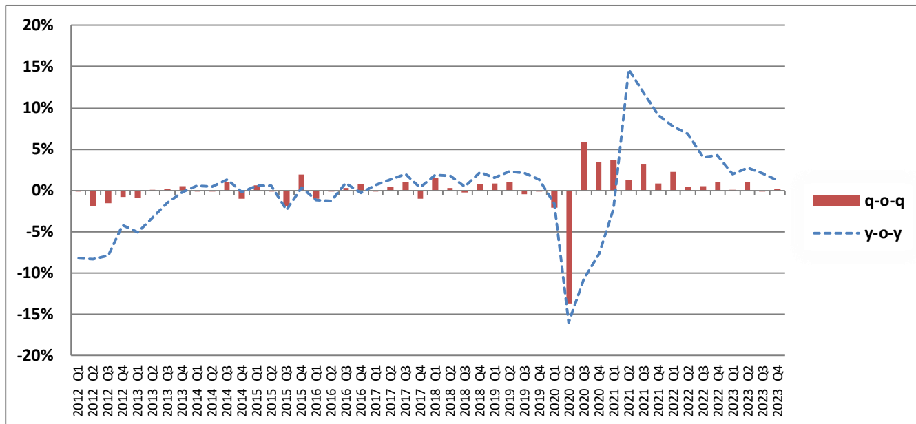
Διάγραμμα 2: Ακαθάριστο Εγχώριο Προϊόν (ΑΕΠ) σε όρους όγκου (Έτος Αναφοράς: 2015) ΜΕ και ΧΩΡΙΣ Εποχική Διόρθωση 2012-2023