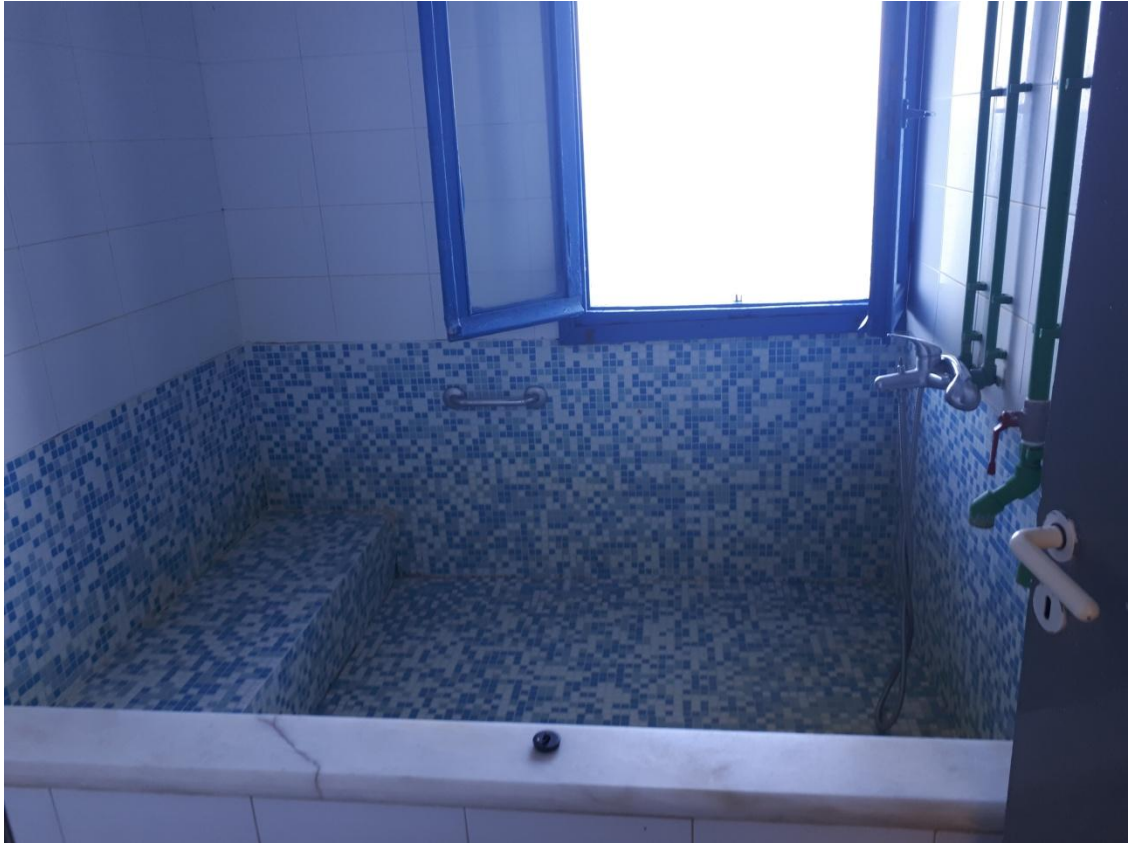
Ατομικό λουτρό ισογείου