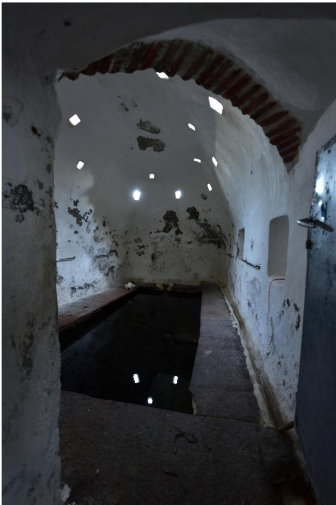
Το οθωμανικό λουτρό