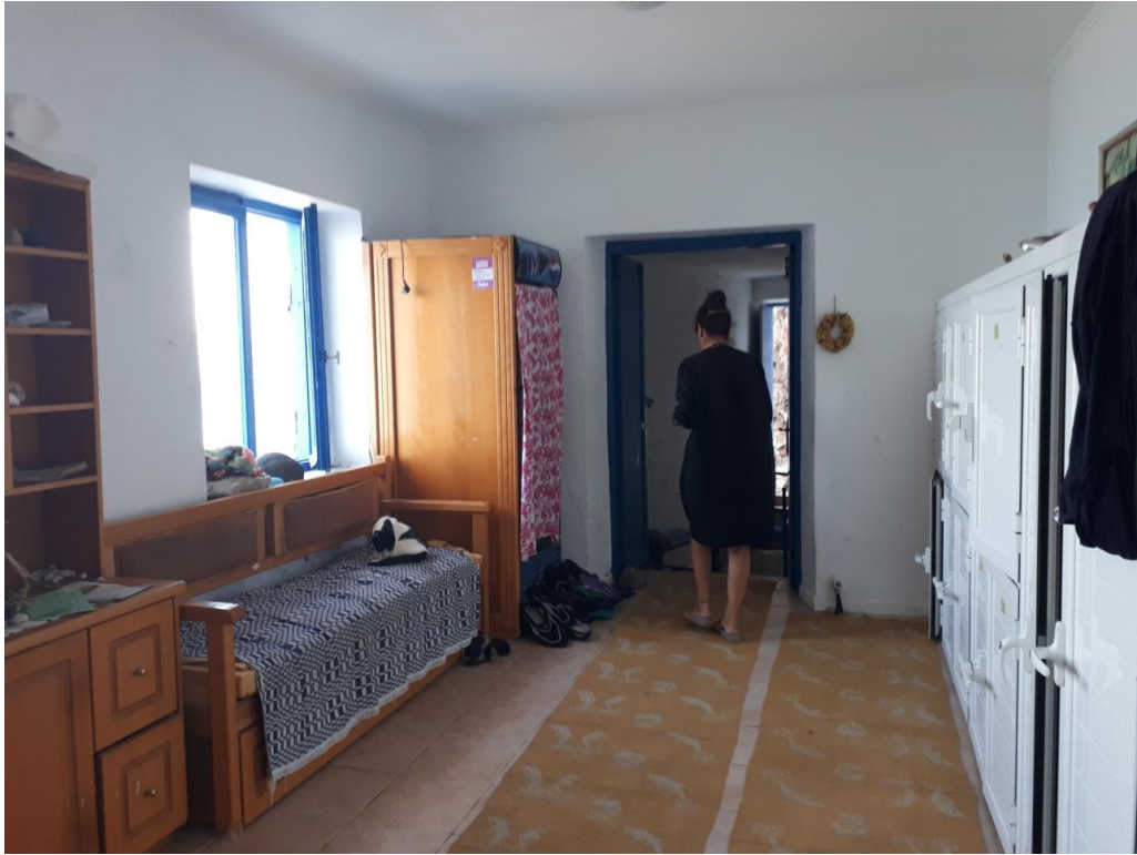
Ο χώρος υποδοχής