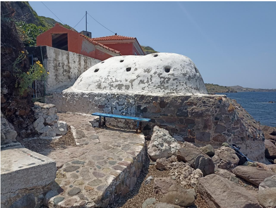
Οι εγκαταστάσεις από την παραλία στα ανατολικά