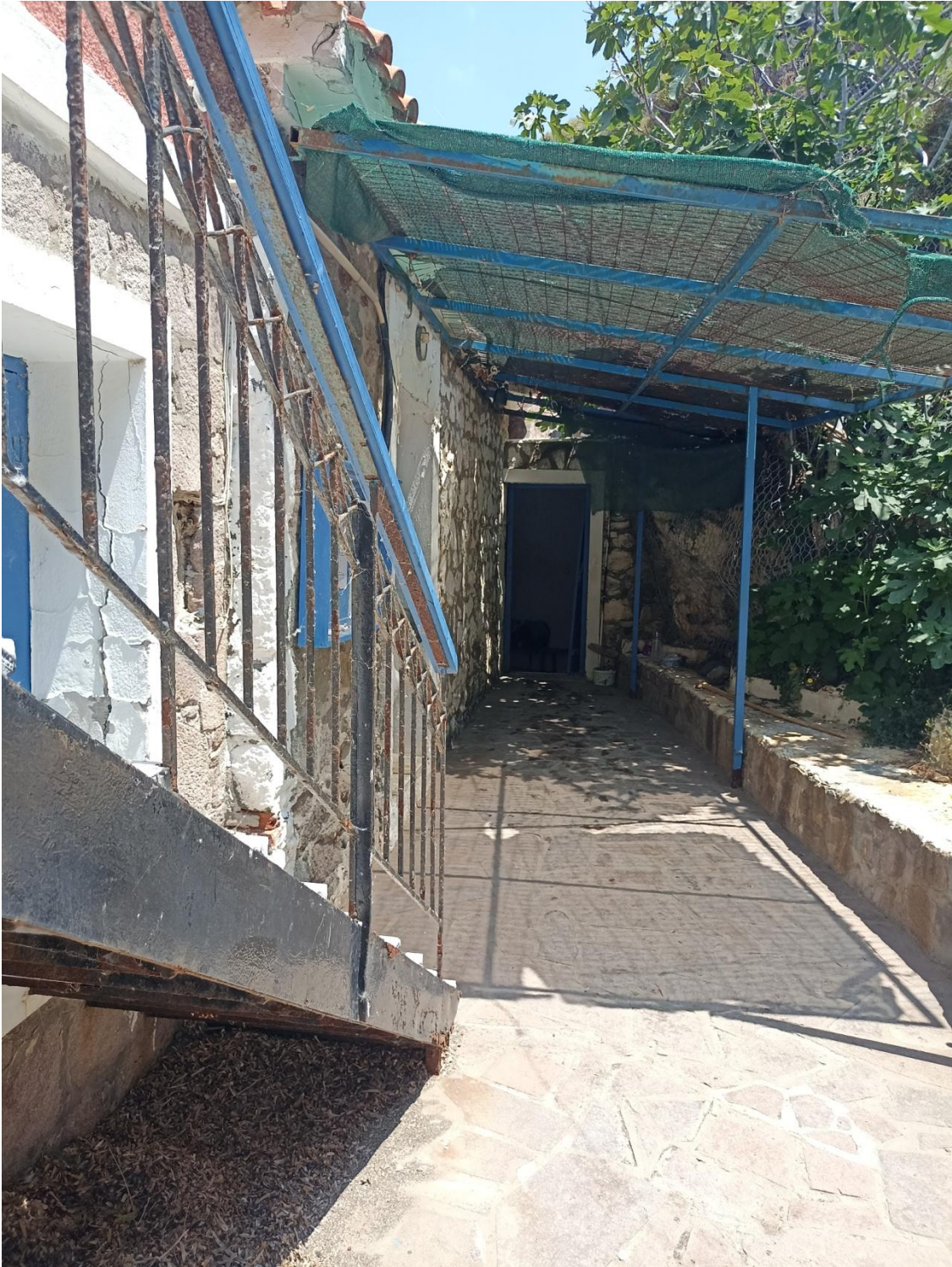
Η είσοδος στα δυο κτίρια