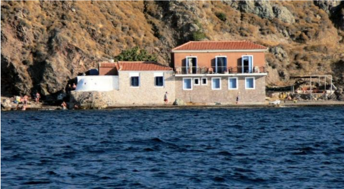
Οι εγκαταστάσεις από τη θάλασσα