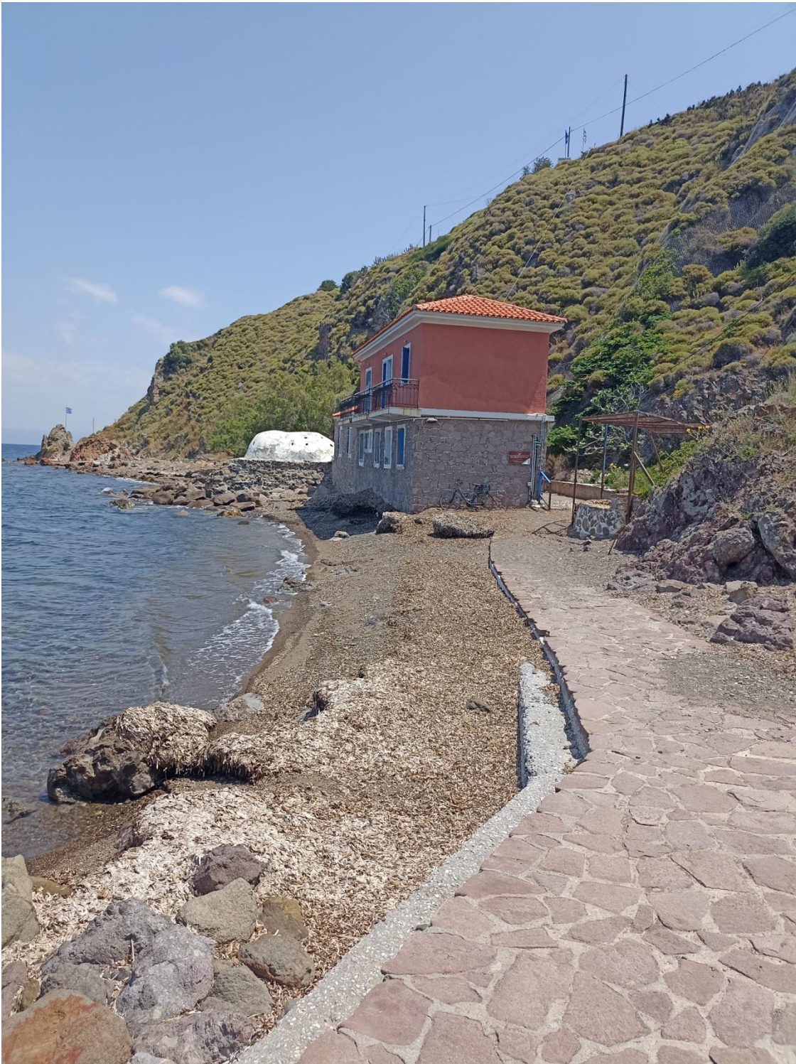
Η είσοδος στο ακίνητο από δυτικά