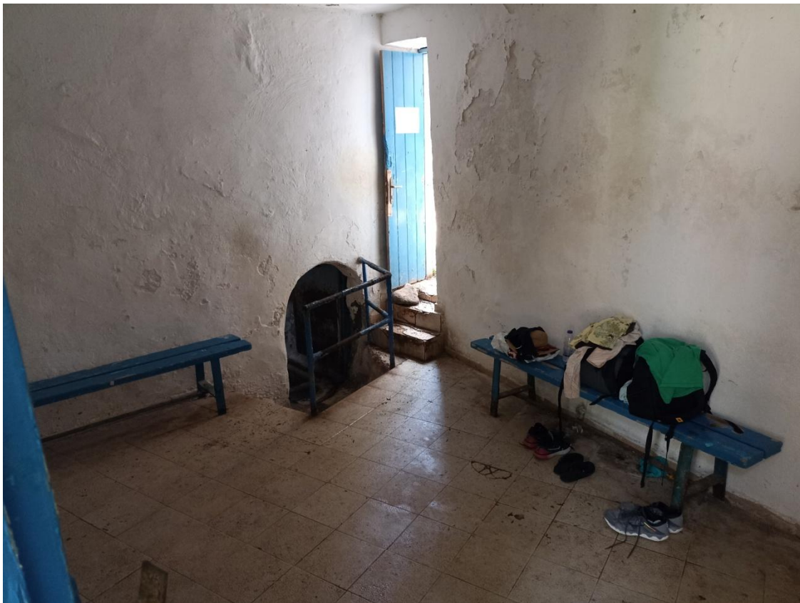
Ο προθάλαμος του οθωμανικού λουτρού