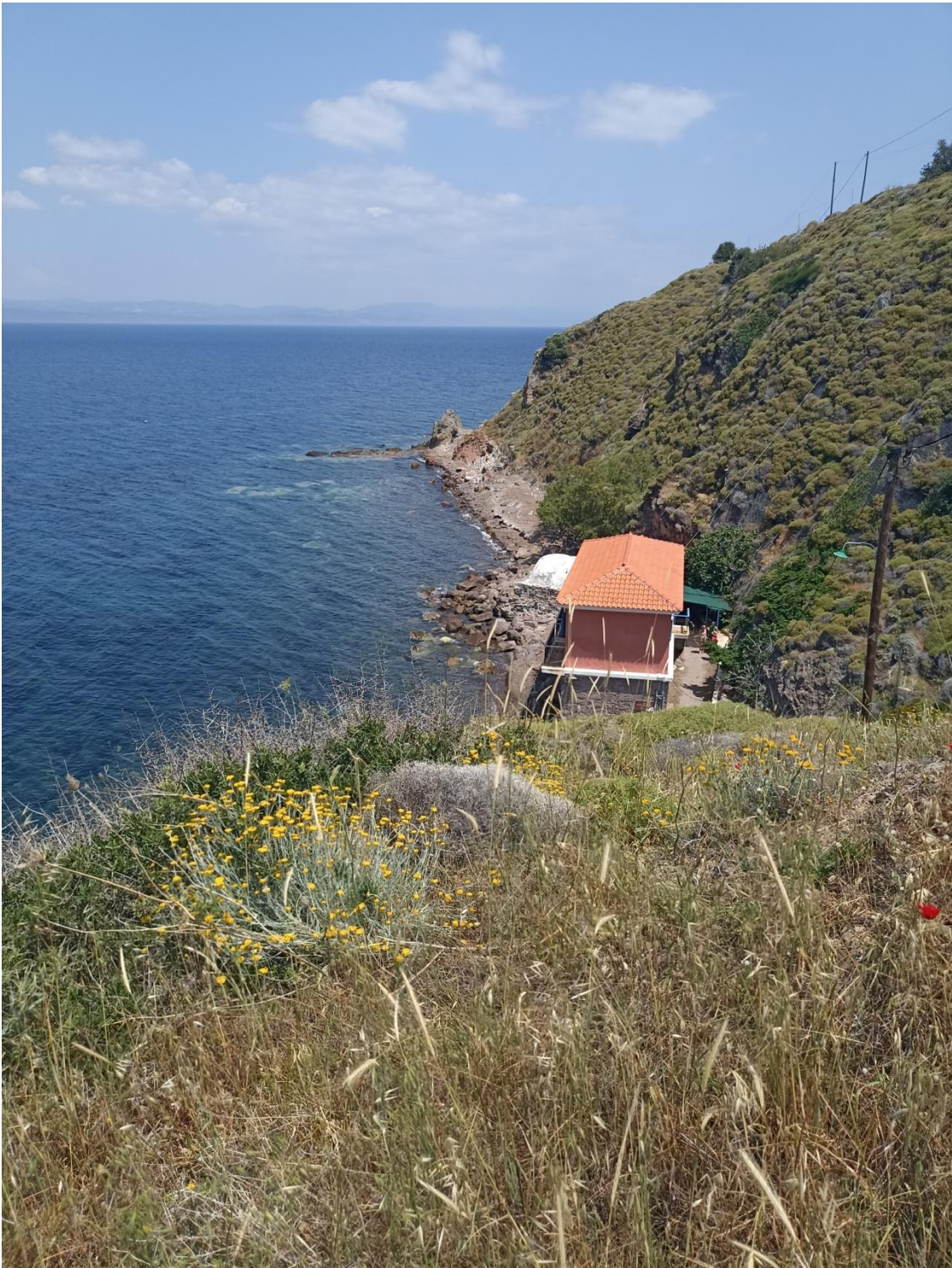
Οι εγκαταστάσεις από το δημοτικό δρόμο