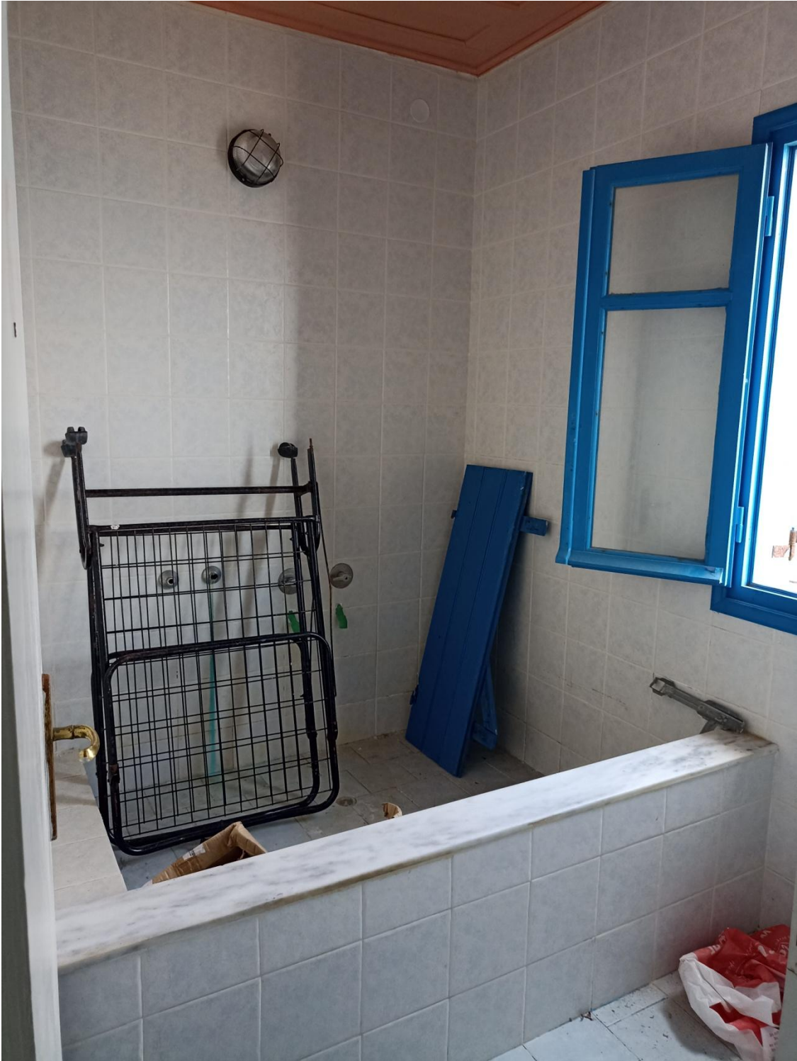
Ατομικό λουτρό ορόφου