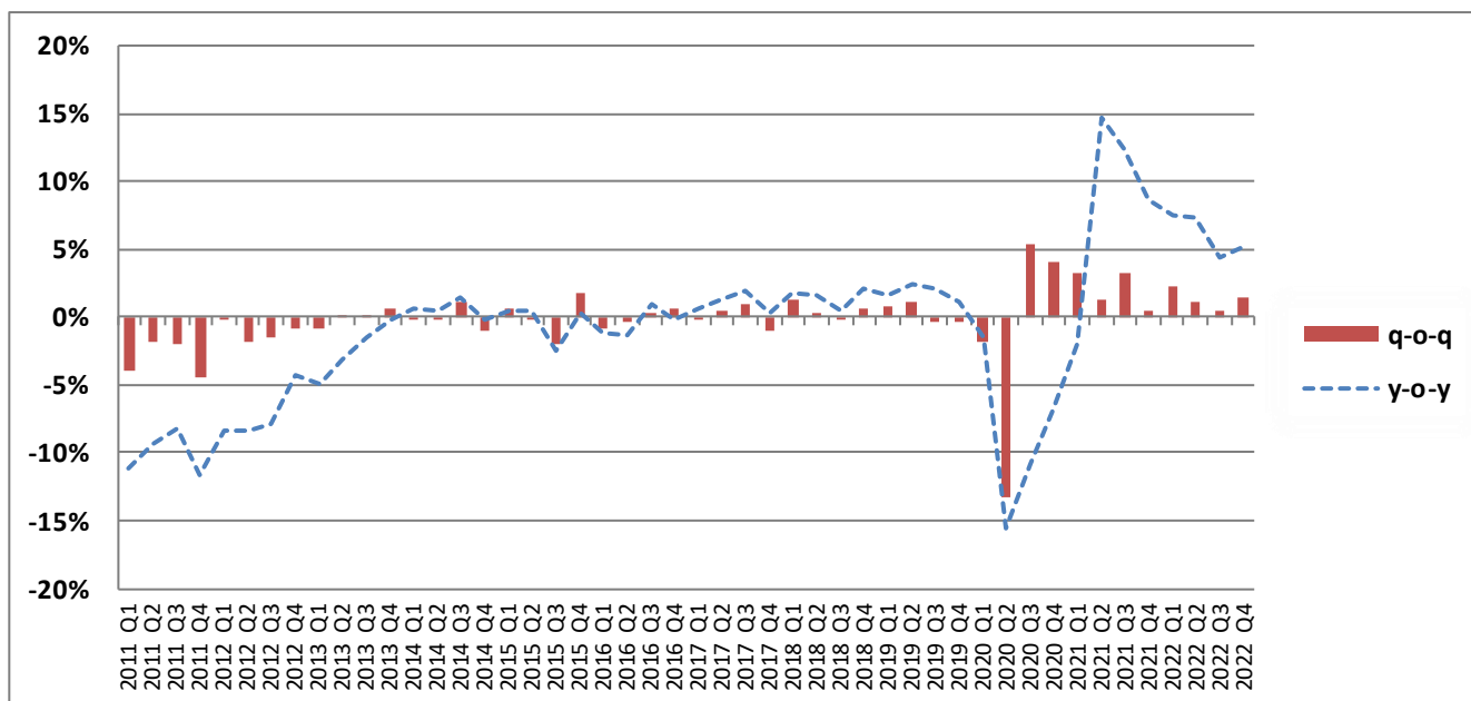
Διάγραμμα 2: Ακαθάριστο Εγχώριο Προϊόν (ΑΕΠ) σε όρους όγκου (Έτος Αναφοράς: 2015) ΜΕ και ΧΩΡΙΣ Εποχική Διόρθωση 2011-2022