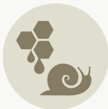
ΜΕΛΙ - ΣΗΡΟΤΡΟΦΙΑ - ΣΑΛΙΓΚΑΡΙΑ