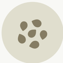
ΣΠΟΡΟΙ & ΠΟΛΛΑΠΛΑΣΙΑΣΤΙΚΟ ΥΛΙΚΟ