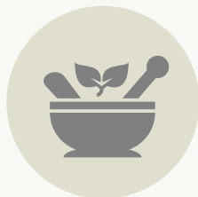
ΦΑΡΜΑΚΕΥΤΙΚΑ ΚΑΙ ΑΡΩΜΑΤΙΚΑ ΦΥΤΑ