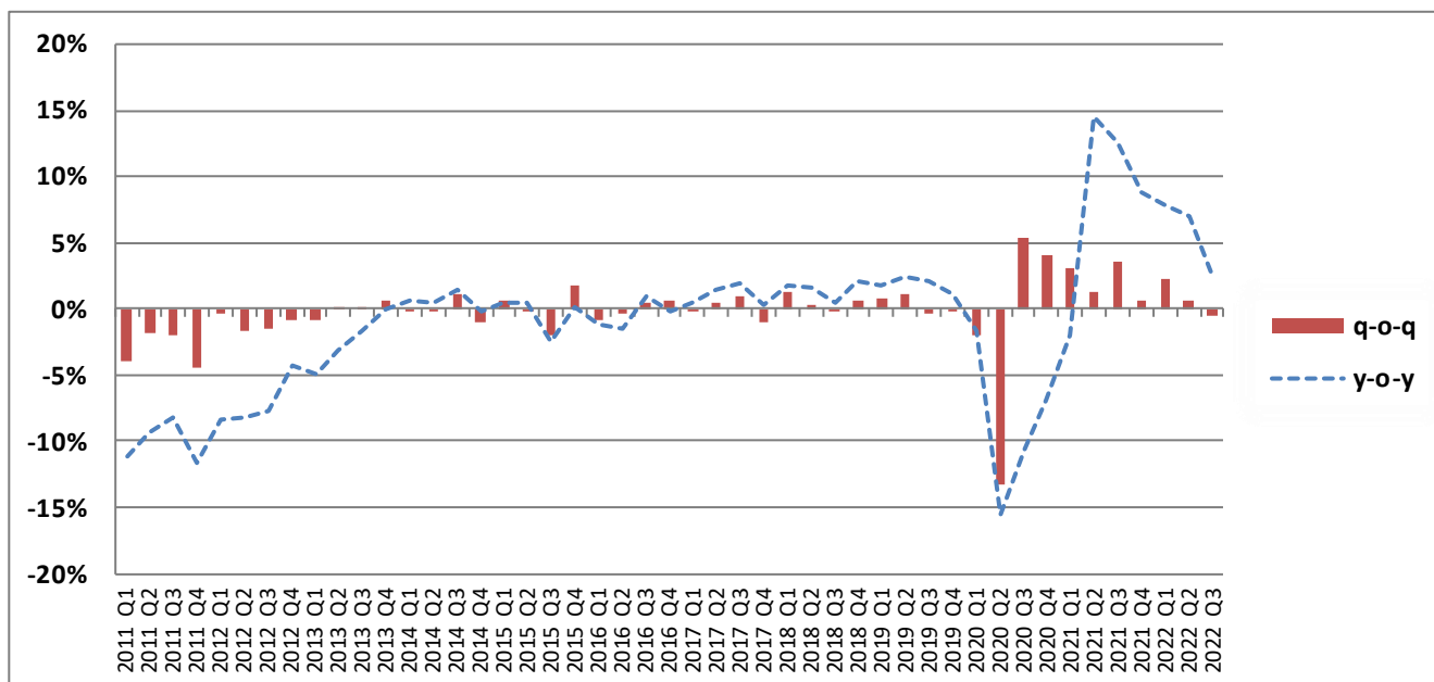
Διάγραμμα 2: Ακαθάριστο Εγχώριο Προϊόν (ΑΕΠ) σε όρους όγκου (Έτος Αναφοράς: 2015) ΜΕ και ΧΩΡΙΣ Εποχική Διόρθωση 2011-2022