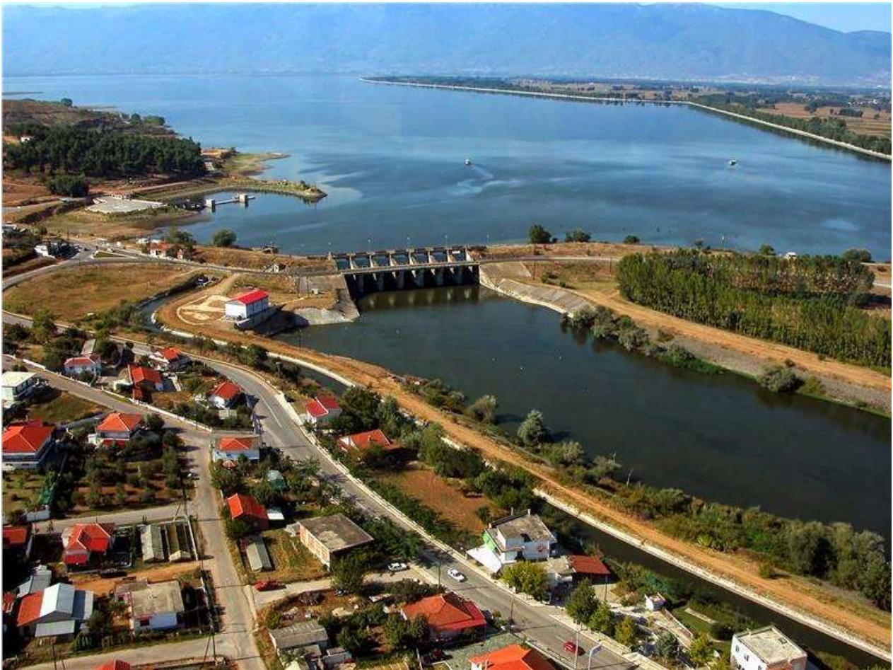
Εικόνα 3. Τεχνητός ταμιευτήρας και φράγμα της λίμνης Κερκίνης