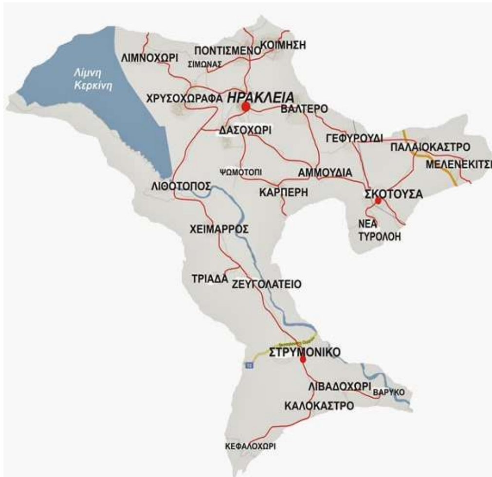
Εικόνα 3. Τοπωνύμια περιοχής της Λίμνης Κερκίνης

Ο συνδυασμός των προβλημάτων που αναφέραμε παραπάνω δημιούργησε την ανάγκη και οδήγησε στην κατασκευή του τεχνητού ταμιευτήρα της Κερκίνης το 1932, στη θέση όπου μέχρι τότε υπήρχε η μικρότερη λίμνη του Μπούτκουβου. Η κατασκευή επετεύχθη με τη δημιουργία φράγματος επί του Στρυμόνα στο ΒΔ τμήμα του Νομού Σερρών (στο ύψος